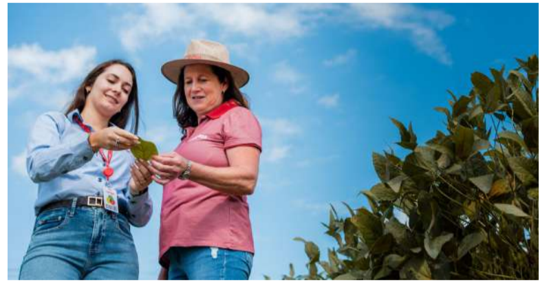
No Rio Grande do Sul, 4,4 milhões de pessoas são associadas a alguma cooperativa e o movimento gera 80,5 mil empregos

Na Cotrijal, o futuro, a capacitação e a inclusão de novos públicos também são preocupações constantes, visando à sustentabilidade. Por isso, a cooperativa investe na