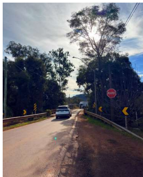
Entre as ações previstas está a construção de uma nova pista sobre a ponte da ERS-132

De acordo com a Administração Municipal, os convênios viabilizam novos recursos para a execução de projetos considerados estratégicos para o desenvolvimento local. A formalização das parcerias contou com o apoio do deputado estadual Dirceu Franciscon e de órgãos do Governo do Estado envolvidos nas negociações.