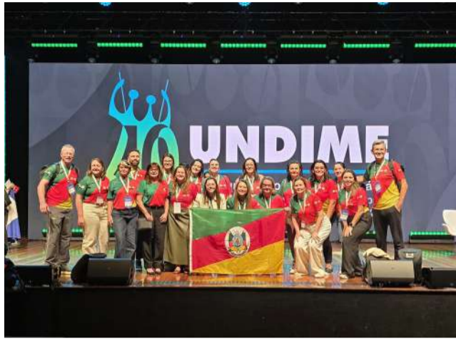
Evento será realizado em Casca no dia 17 de julho

A programação contará com palestras e oficinas práticas, abordando temas como inteligência artificial na educação, inclusão, alfabetização, educação infantil, neurociência, saúde emocional, liderança, gestão escolar, comunicação e inovação pedagógica. Os participantes poderão escolher oficinas de acordo com sua área de atuação.