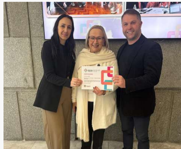
Reconhecimento destaca o trabalho da equipe da Unidade Sanitária Jardim Brasil