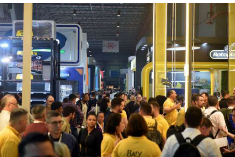
Feira será realizada de 18 a 20 de agosto, no Centro de Eventos FIERGS, em POA

Associados AGAS terão acesso a uma área VIP ampliada, com mais conforto, atendimento especializado e espaço para networking com expositores, autoridades, patrocinadores e convidados. A feira contará com reconhecimento facial no acesso, e o serviço de transporte fretado a partir de hotéis da capital será mantido para facilitar o deslocamento dos participantes.