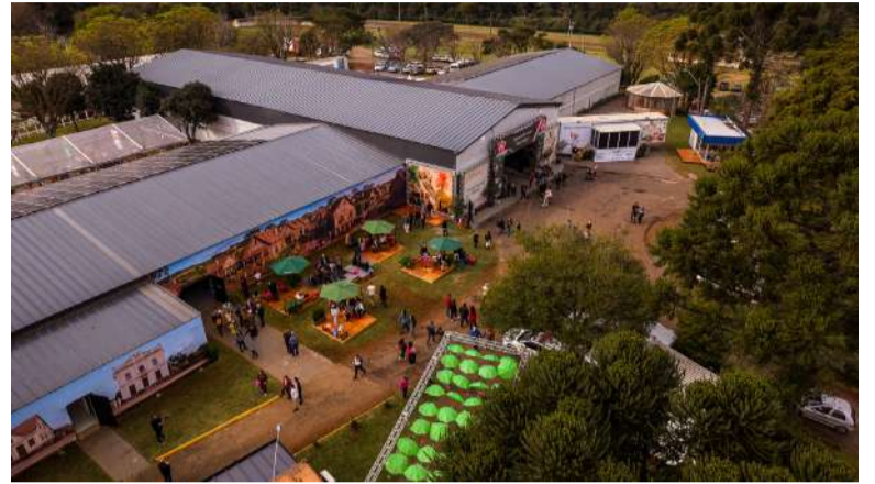
Festival recebeu o maior público no sábado

Foram disponibilizados diversos pontos gastronômicos com pratos à base de salame, incluindo receitas tradicionais e releituras criativas. O público também teve acesso a produtos de vinícolas da Serra Gaúcha, cervejarias artesanais