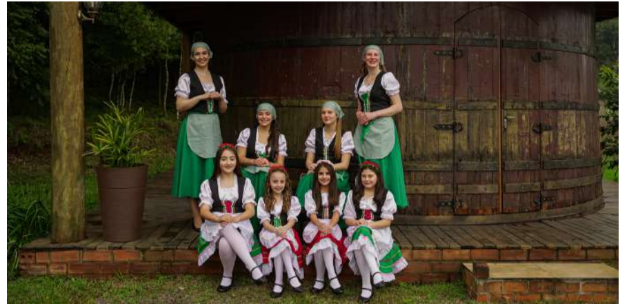
Coroação será no dia 17 de julho

O município de Gentil conquistou um reconhecimento na área da saúde. Por meio da equipe PSF Centro (INE 425060), o município recebeu da Secretaria da Saúde do Estado do Rio Grande do Sul a certificação "Equipe de Saúde da Família Amiga da Mãe, Parceria e Criança - 2025", concedida pelo programa Rede Bem Cuidar RS. A certificação reconhece equipes da Atenção Primária à Saúde que