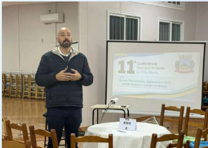
Com o tema "Saúde, Democracia, Soberania e SUS: Cuidar do Povo é Cuidar do Brasil", a conferência proporcionou um espaço de diálogo e participação popular