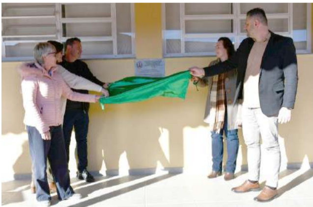
Obra contou com investimento de R$ 1,8 milhão em recursos próprios

Na sexta-feira, 3/07, a Prefeitura de Serafina Corrêa, através da Secretaria de Educação, inaugurou oficialmente a ampliação da EMEF Prefeito Guerino Massolini. A cerimônia reuniu alunos, familiares, equipe diretiva, comunidade escolar, autoridades e imprensa.