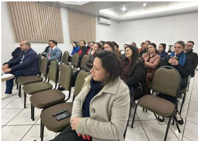
Evento será realizado nos dias 19 e 20/08