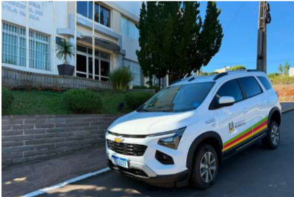
Veículo recebido é um Chevrolet Spin LT para o transporte de cadeirantes

Além do veículo, Vila Maria também recebeu um kit composto por abafador de ruído e cubo sensorial, materiais destinados ao atendimento de pessoas com Transtorno do Espectro Autista (TEA). A iniciativa integra as ações do programa estadual voltadas ao fortalecimento das políticas públicas de inclusão e acessibilidade para pessoas com deficiência.