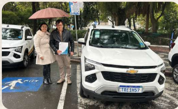
Entrega ocorreu no dia 2 de julho, em Porto Alegre

A entrega representa mais um importante investimento na inclusão e na qualidade dos atendimentos oferecidos à população, reafirmando o compromisso da Administração Municipal em promover mais qualidade de vida e dignidade aos camarguenses.