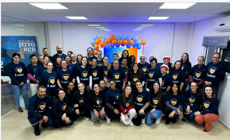
Iniciativa reuniu colaboradores de todos os setores da instituição em diferentes encontros

O lançamento representa o início de uma jornada que será construída ao longo dos próximos meses. O Programa Cumprimentar Faz Bem será desenvolvido em etapas, com ações direcionadas para cada setor da instituição, respeitando as características de cada equipe e promovendo atividades específicas para fortalecer, gradativamente, a cultura de acolhimento em todos os ambientes.