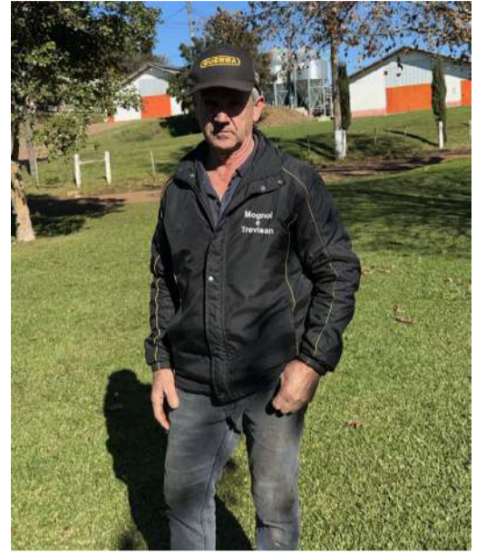
Dia Internacional do Cooperativismo foi celebrado no dia 4 de julho

Como acontece com muitos empreendedores, os primeiros passos vieram acompanhados de desafios. Mesmo com um projeto estruturado, a empresa recém-criada