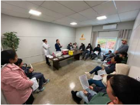
Vacinação foi realizada em empresas do município

A Secretaria Municipal de Saúde orienta que a população procure a Sala de Vacinas da Unidade Básica Central para mais informações e vacinação. O atendimento é realizado de segunda a sexta-feira, das 7h30 às 11h e das 13h às 16h30.