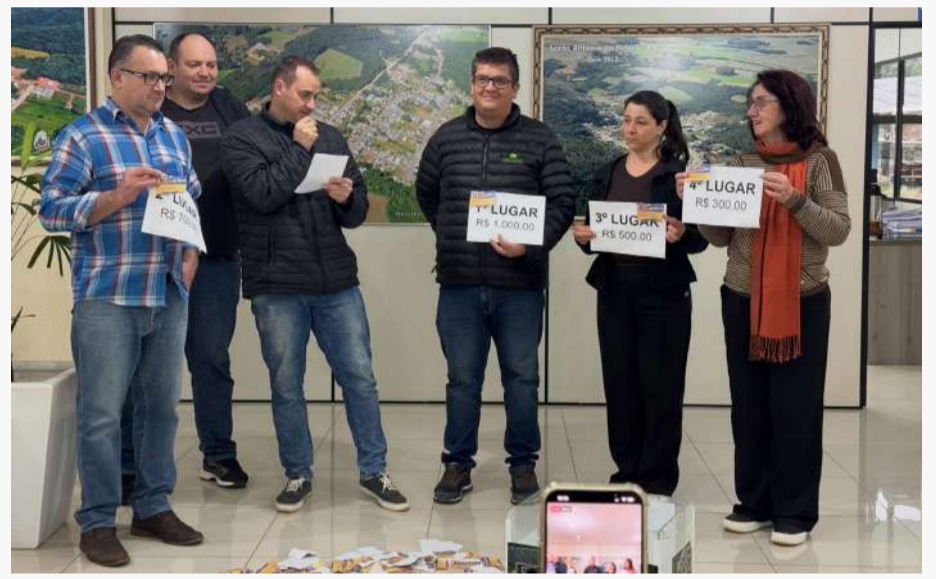
Quatro participantes foram contemplados com premiações em dinheiro

Após a realização do sorteio, a Administração Municipal agradeceu a participação dos contribuintes e informou que o segundo sorteio do Programa “Nota de Santo Antônio do Palma Dá Prêmios” está previsto para ocorrer no dia 23 de dezembro, durante a programação do Show de Natal do município.