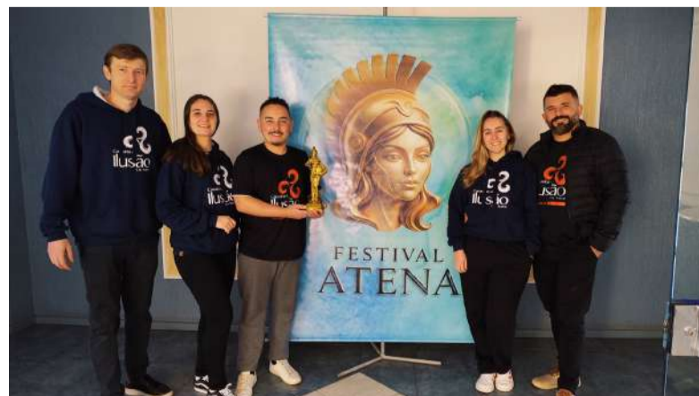
A trupe recebeu o Troféu Atenita e lotou a plateia com o espetáculo "Flor de Maracujá"

A companhia está em fase de criação de um novo espetáculo, preparando novas histórias e personagens que serão apresentados em breve. A expectativa do grupo é ampliar o diálogo com o público e manter a valorização da cultura popular.