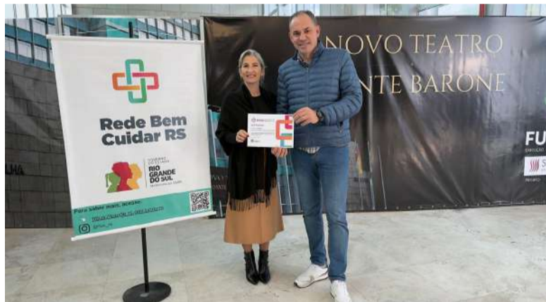
Gestores estiveram em Porto Alegre nos dias 2 e 3 de julho

Durante a agenda na capital, Vila Maria também recebeu a certificação da Rede Bem Cuidar, reconhecimento concedido aos municípios que se destacam no acompanhamento de gestantes, mães, parceiros e crianças na atenção primária à saúde.