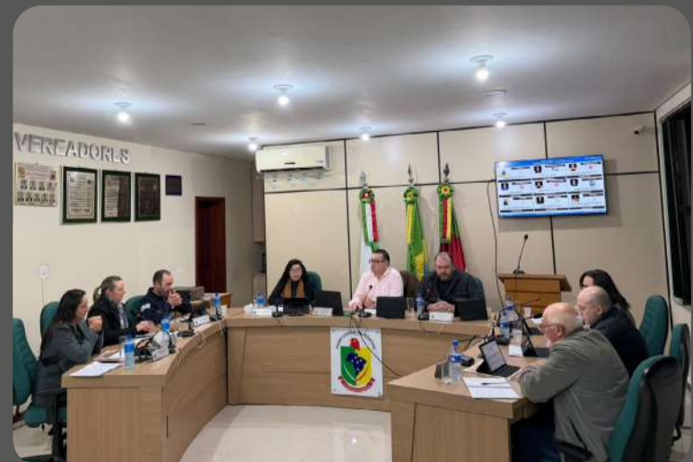
As sessões plenárias são realizadas nas terças-feiras, a partir das 19h

Projeto de Lei Municipal nº21 de 26 de junho de 2026 que: "altera a Lei Municipal nº1719/2023 que institui o programa de incentivo a hortifruticultura, denominado pomar ativo." Ambos aprovados por unanimidade.