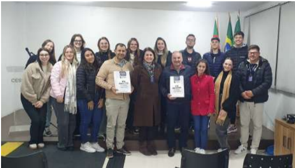
Parceria visa impulsionar o turismo nos 15 municípios que integram a entidade