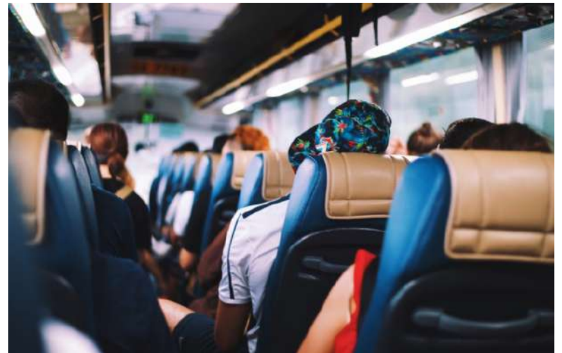
Prazo para realizar o processo fica aberto até o dia 21 de julho

A AUVIMA informa que será cobrada uma taxa de semestrali-