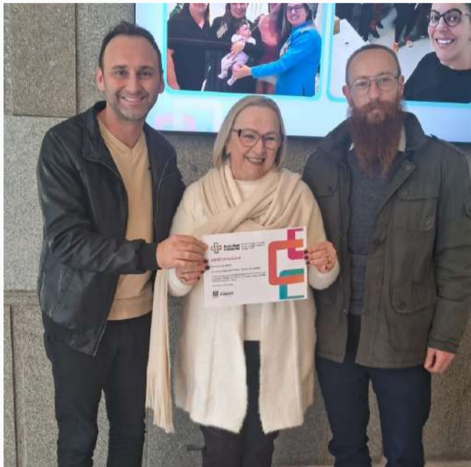
Município conquistou certificação do programa Rede Bem Cuidar RS

A Administração Municipal parabeniza todos os profissionais da equipe do PSF Centro pelo empenho, dedicação e excelência no atendimento prestado à população. A conquista reafirma o compromisso de Gentil em oferecer uma saúde pública cada vez mais humanizada, eficiente e de qualidade.