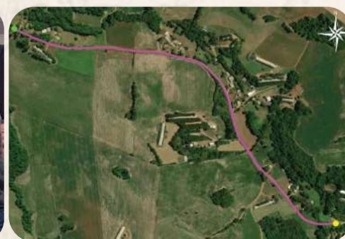
Obra contempla a pavimentação de 1,631 km, com investimento de R$ 1 milhão