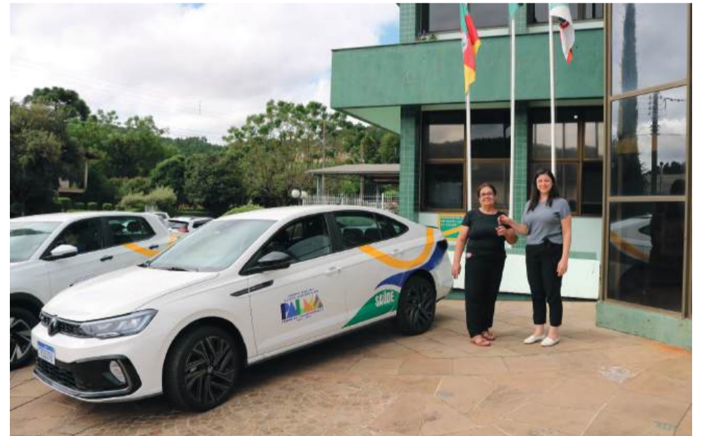
Dois são modelo Volkswagen T-Cross e um Volkswagen Virtus