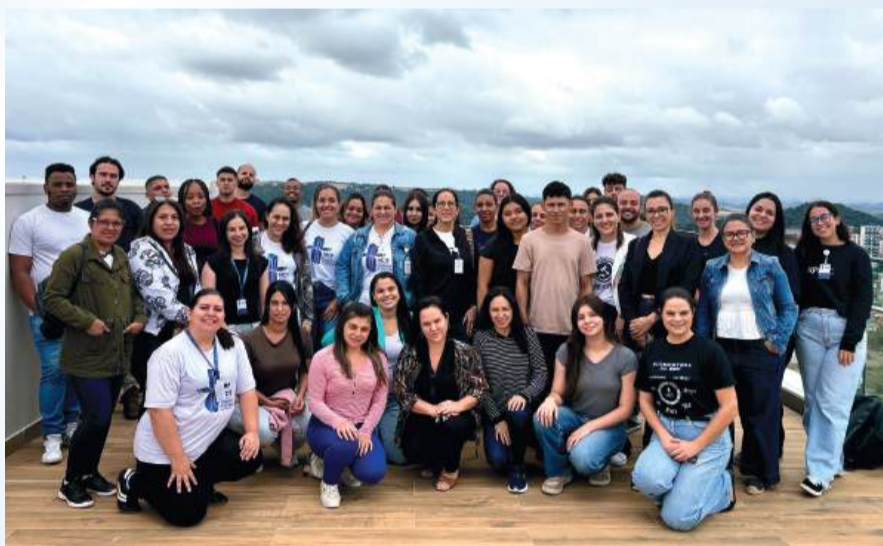
Ação tem como objetivo acolher e integrar os novos colaboradores