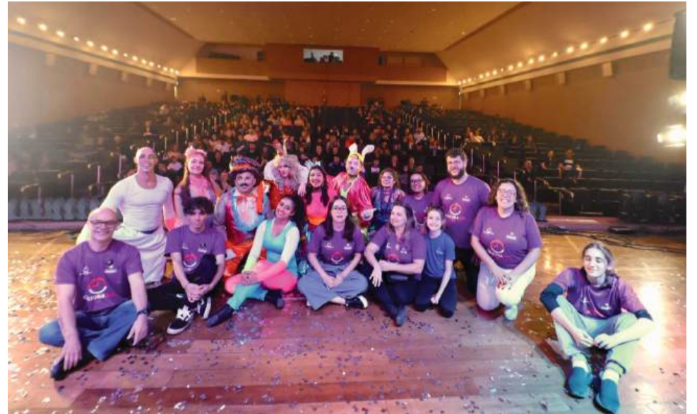
Evento será realizado de 5 a 10 de maio, na Casa da Cultura de Marau

A programação completa com horários e datas das apresentações e exposições pode ser acessada em nosso site: jornalfatoregional.com.br .