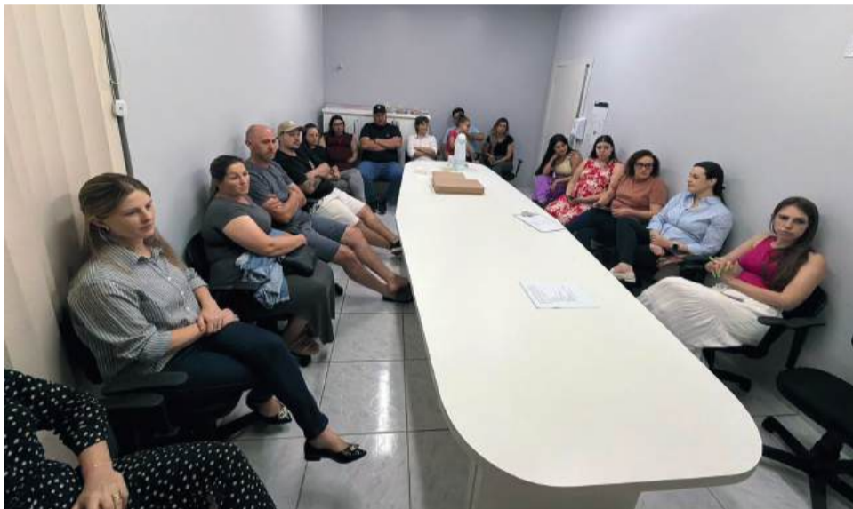
Grupo de gestantes

Ambas as iniciativas são abertas à participação do público-alvo. Interessados podem buscar informações junto à Unidade Básica de Saúde ou com o Agente Comunitário de Saúde da área de residência.