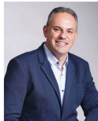
Prefeito de Vila Maria, Adroaldo Seben

Para informações atualizadas sobre funcionamento e visitação, a prefeitura disponibiliza atendimento pelo telefone (54) 3359-1200.