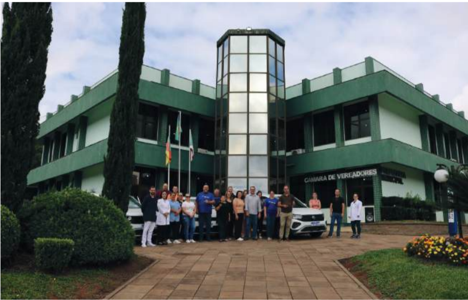
Município adquiriu três automóveis através de emendas parlamentares

Segundo a gestão municipal, os recursos contribuem para a manutenção e ampliação dos serviços de saúde, incluindo transporte de pacientes, aquisição de equipamentos e custeio de atendimentos.