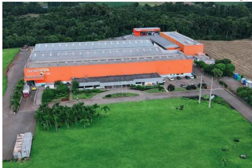
Empresa está situada às margens da ERS-324, no Distrito Industrial de Vila Maria