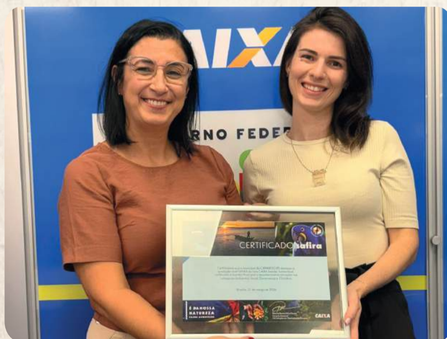
Selo avalia e certifica iniciativas voltadas à sustentabilidade e à gestão responsável