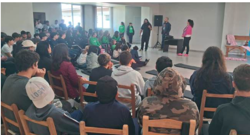
Ação de lançamento contou com a participação de estudantes do município

A programação completa será divulgada em breve por meio das redes sociais oficiais da Prefeitura de Gentil.