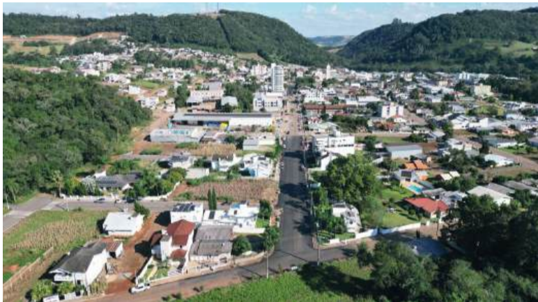
As comemorações marcam o aniversário de 38 anos do município