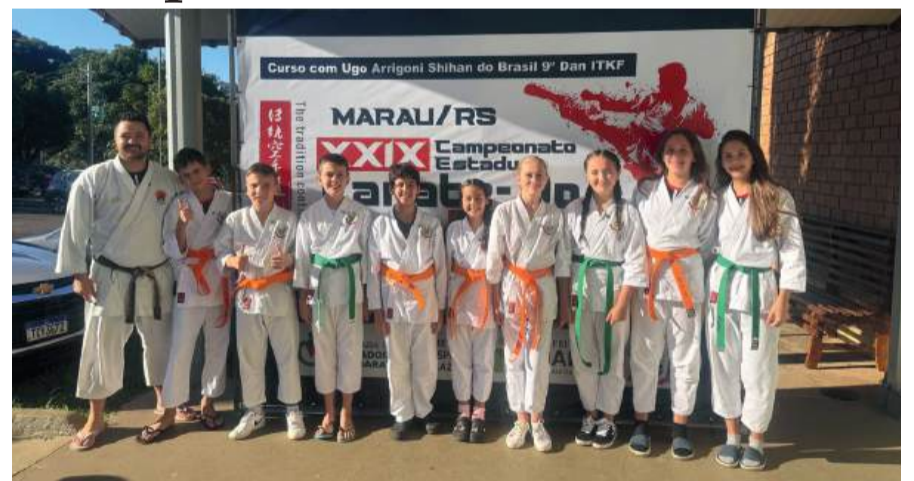
Competição foi realizada nos dias 10 e 11 de abril, em Marau

O município de Gentil esteve representado no Campeonato Estadual de Karatê, realizado nos dias 10 e 11 de abril, em Marau. A competição reuniu atletas de diversas regiões do estado e contou com a participação de 11 representantes gentilenses.