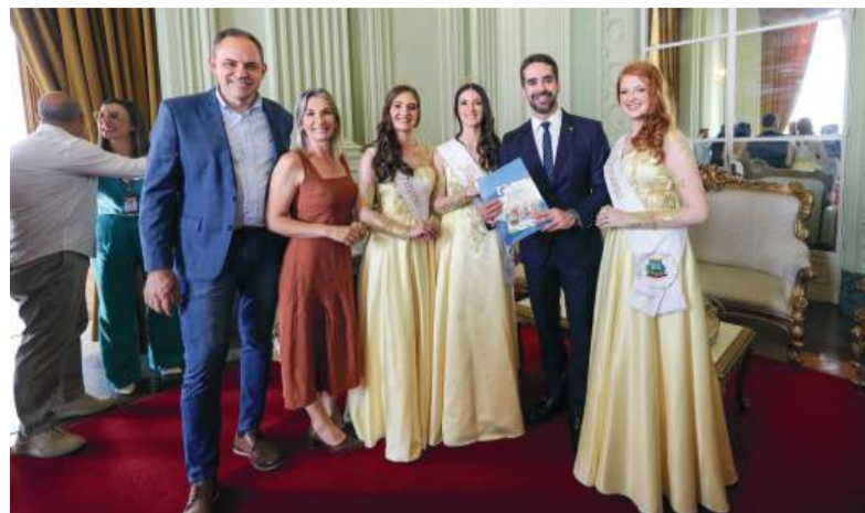
Grupo esteve no Palácio Piratini, na Assembleia Legislativa e outros locais

A iniciativa teve como objetivo divulgar a ExpoVima, evento que integra o calendário do município e destaca aspectos culturais, econômicos e produtivos de Vila Maria.