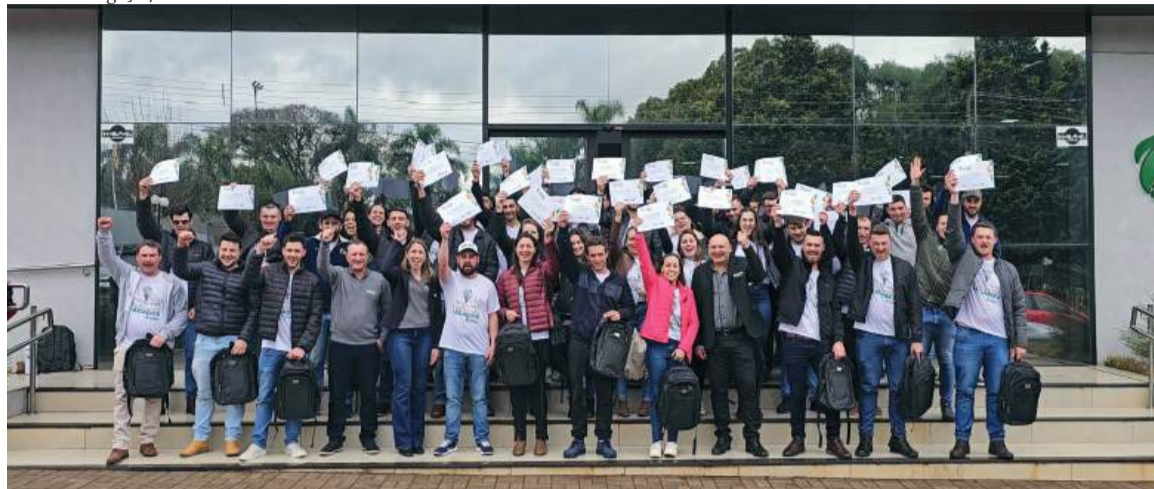
Iniciativa voltada a jovens de 18 a 35 anos reúne formação técnica e visita ao Porto de Rio Grande

A Coasa está com inscrições abertas para a nova edição do Cultivando Legados, iniciativa voltada à formação de jovens entre 18 e 35 anos ligados às famílias cooperadas. O programa busca estimular a participação das novas gerações no cooperativismo e no agronegócio, promovendo capacitação, troca de experiências e aproximação com diferentes áreas da cadeia produtiva.