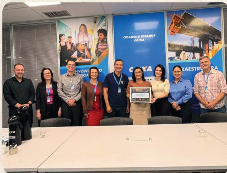
Trata-se de um reconhecimento da Caixa Econômica Federal

O Selo Caixa Gestão Sustentável - Nível Safira é um reconhecimento da Caixa Econômica Federal a municípios que adotam práticas eficientes de governança, sustentabilidade e responsabilidade socioambiental. Ele avalia indicadores ambientais, sociais, climáticos e de governança. O nível Safira indica alto desempenho, exigindo pontuação elevada (geralmente acima de 80 pontos) após avaliação técnica.