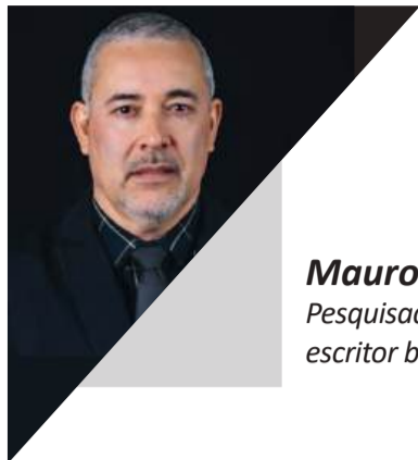
Mauro Falcão Pesquisador e escritor brasileiro