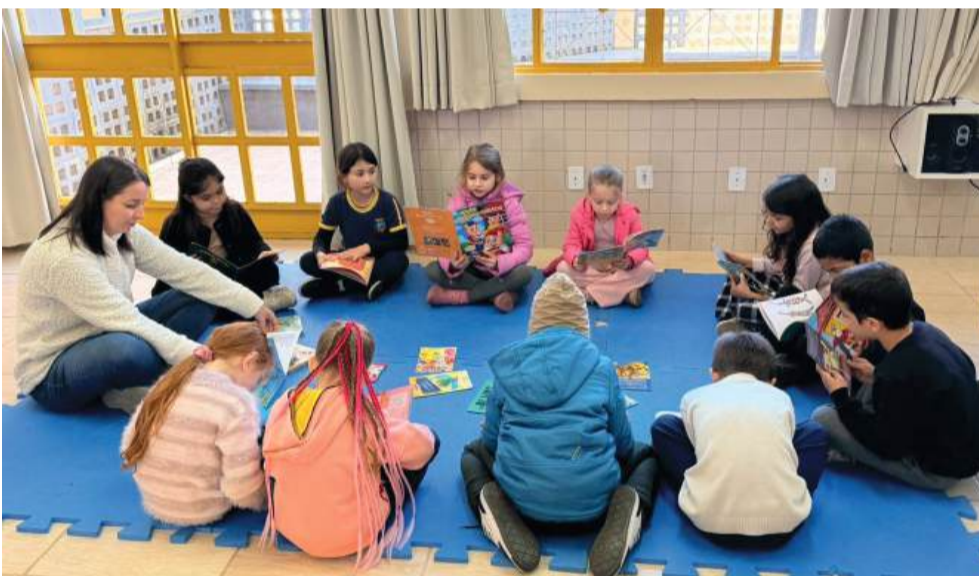
Município superou as médias estadual e nacional, segundo dados do Inep

O município de Vila Maria registrou avanço significativo no desempenho educacional ao alcançar 77% de alunos alfabetizados ao final do segundo ano do ensino fundamental em 2025, conforme dados do Indicador Criança Alfabetizada, divulgado pelo Instituto Nacional de Estudos e Pesquisas Educacionais Anísio Teixeira (Inep).