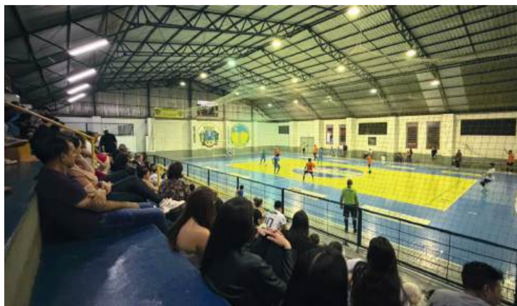
Ingressos estão à venda para o jantar de encerramento da competição

A fase de quartas de final será realizada no domingo, 26/04, a partir das 18h. Confira os confrontos: